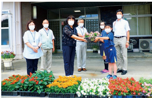
人権の花の苗を贈呈しました

人権擁護委員の皆さんが6月16日、小野小学校を訪問し、マリィーゴルドやサルビアなど、人権の花の苗を贈呈しました。 人権の花運動は、小学生が互いに協力し合って花を育てることにより、生命の尊さを実感する中で、優しい心や相手を思いやる心を育むとともに、自分たちが手入れをした花を観賞することで、情操を豊かにし、人権尊重について理解を深めることを目的に実施されています。 贈呈された花の苗は小野高校で栽培されたもので、今後は小学校で大切に育てられます。