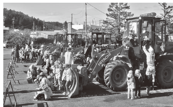
乗車体験する子どもたち