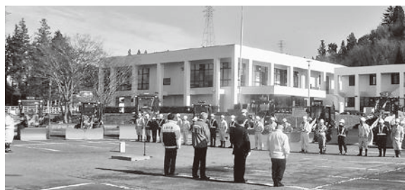
除雪車両出動式の様子

※除雪作業の詳細な内容については、本誌23ページ掲載の「除雪作業にご協力お願いします」をご覧ください。