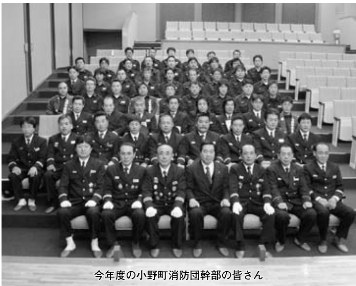
今年度の小野町消防団幹部の皆さん