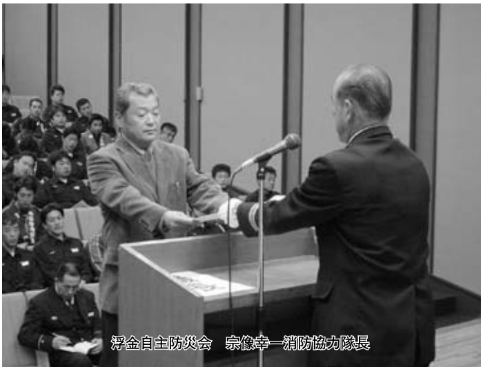
浮金自主防災会 宗像寺一消防協力隊長