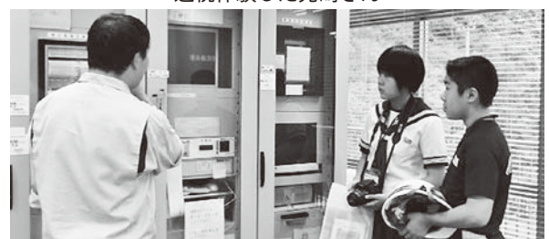
管理室で説明を受ける様子