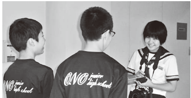
インタビューの様子