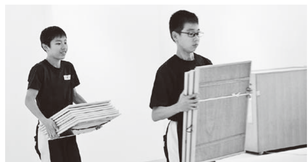
展示で使用した額を運びます