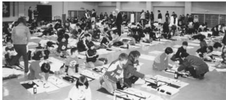
大作に取り組む参加者