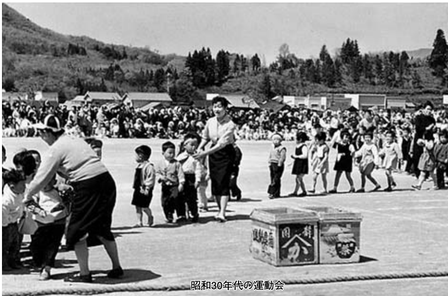
昭和30年代の運動会

平成十七年度は、「合併五十周年」にちなんだ各種事業を実施します。多くの皆様のご参加をお願いします。