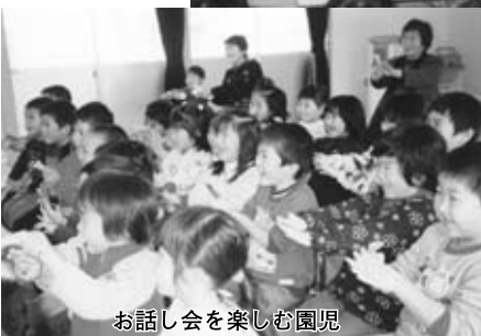
お話し会を楽しむ園児

飯豊ひまわり保育園では、楽しい、嬉しい、悲しい、かわいそう、などの心を育てていくため「ふるさと文化の館」の職員による『お話し会』を行っています。 季節に合ったお話しや、手遊びなどをとおして、楽しい時間をすごしていますが、子どもたちが絵本の中に引き込まれ、登場人物になりきり一喜一憂している姿を見ると、『お話し会』から得るものは大きいものだと感じます。 幼児保育では、「子どもの心と体の正常な発達」が大事ですが、小さいうちから心の栄養をたくさん蓄えられるよう、これからも『お話し会』や日ごろの保育時間の中で、良いお話しをたくさん聞かせ、情緒豊かな保育を行っていききたいと思えます。