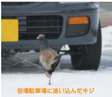
役場駐車場に迷い込んだキジ

昨年末から、にせ札事件が多発しています。「通貨偽造」の罪は、江戸時代では「獄門はりつけ」。今日でも殺人・放火に次ぐ重罪で、列車転覆罪と同罪です。新紙幣は精巧な偽造防止策が施されていますが、それよりも社会全体に与える影響を考慮し重罪となっていることを認識することが大切なのではないでしょうか。・・・ (松)