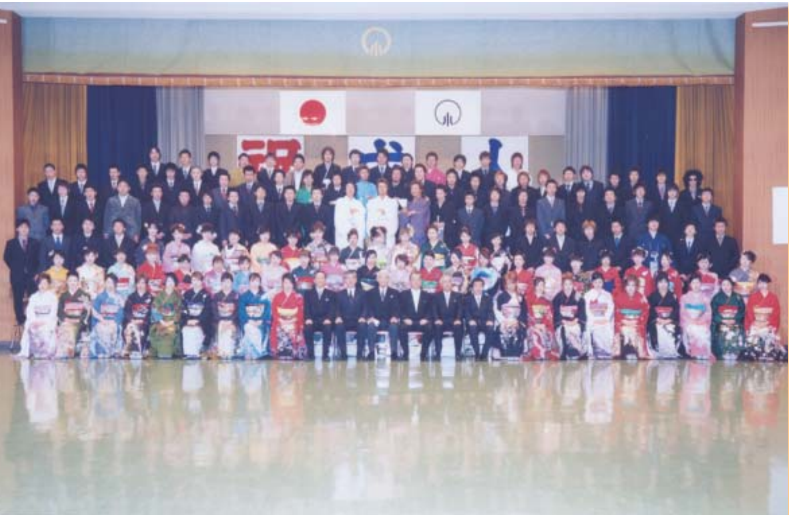
小野町成人式：小野町多目的研修集会施設