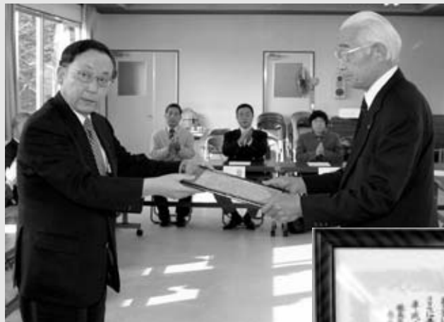
福島県交通対策協議会長表彰を受けました

一月二十一日をもって、平成十四年四月二十八日より続いた、小野町内の「交通死亡事故ゼロ」の記録が、一〇〇〇日となりました。 一月二十四日、福島県中振興局長より福島県交通対策協議会長（県知事）の表彰状の伝達が行われました。町民のみなさんひとりひとりの交通安全の意識が高揚し、この記録を樹立できました。今後も交通事故防止に町民総ぐるみで取り組み、死亡事故ゼロ二〇〇〇日達成を目標に、安全・安心なまちづくりに取り組みます。