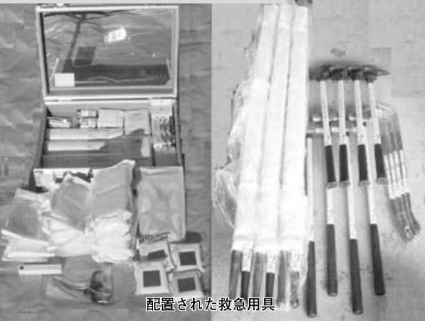
配置された救急用具