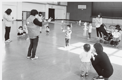
子育てサポーターの活動