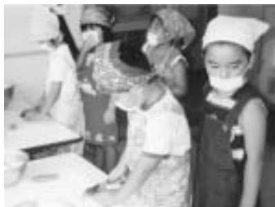
楽しいクッキング

春に年長児の子どもたちが植えたジャガイモを、七月下旬に収穫しました。自分たちで植えたジャガイモなだけに掘り当てるのが大喜びでした。そのジャガイモを利用して、カレー作りをしました。クッキングの日はエプロン・三角巾・マスクを身につけ、ミニコックさんに変身です。皮引きや包丁を初めて持つ子どもも多く、緊張した面持ちでしたが、「楽しかった」「ジャガイモの皮むきは大変だった」と、実際にやってみなければわからない感想をもらっていました。その日の給食は、いつもは野菜が嫌いな年中少の園児たちも「きりん組(年長児クラス)さんを作ってくれたカレーおいしい」と言って、パクパク食べていました。