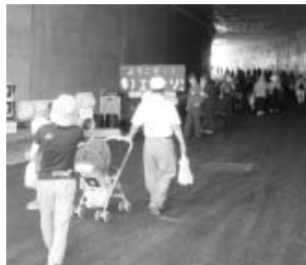
一般開放のもよう

か、同道路整備事業のパネル、道路標識・信号機などの展示、高所作業車の体験乗車、あぶくま町村交流会・福島県建設業