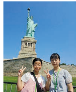
自由の女神像の前で(右)