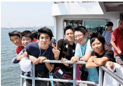
フェリーにて(右から2番目)