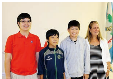
ホストファミリーと(左から2番目)

僕の研修の目標は「ホストファミリーに積極的に話しかけること」でした。はじめは緊張しあまり話しかけることができませんでしたが、だんだん話せるようになりました。ホストファミリーと会話できた時はとてもうれしかったです。ホストファミリーの方々はとても優しくフレンドリーで、彼らも積極的に話しかけてきてくれました。そのおかげで、現地で過ごした日々はとても充実していました。そして「言葉」よりも「伝えようとする気持ち」の方が大事だということに気が付きました。これからは、この経験を生かして頑張っていこうと思いました。