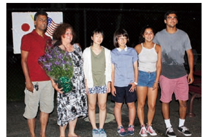
ホストファミリーと(左から3番目)

今回の研修は、この先もずっと思い出に残るものとなりました。この経験を忘れず、普段の生活に生かしていきたいです。