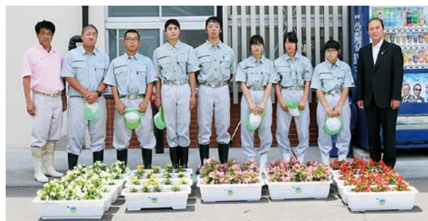
小野高等学校の皆さん

各小学校での栽培の記録は、10月に開催される「小町ふれあいフェスタ」の会場で展示されます。