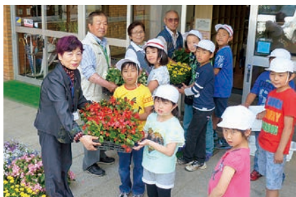
人権擁護委員、浮金小学校の皆さん

町内4つの小学校で「人権の花運動」が行われました。 この運動は、小学生が互いに協力し合い、花を育てることを通して情操を豊かにし、相手を思いやる心や人権の大切さを理解することを目的に実施されます。