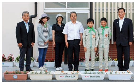
飯豊小学校緑の少年団の皆さんと関係者の皆さん