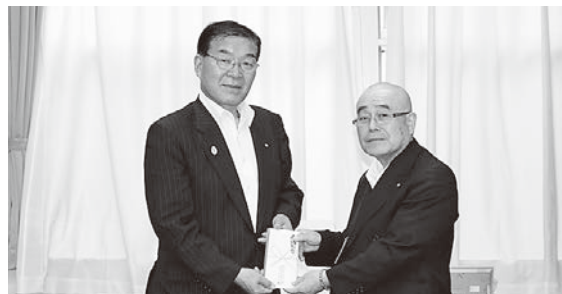
町長(左)に寄付を手渡す先崎代表取締役