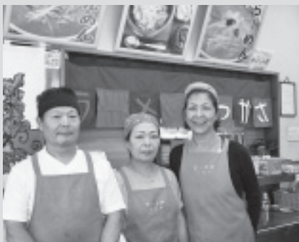
ラーメンつかさ(飯豊下) ☎72-6245

一部の野菜は自家栽培もしており、手作りの料理と味にこだわっています。お客様に喜んでいただける健康面に配慮した料理とサービスを提供しています。