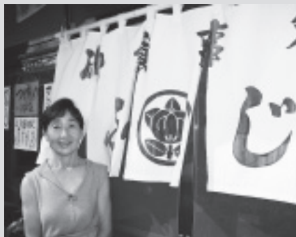
釜めしや ふじ(中通) ☎72-4425

お客様の健康づくりのため、栄養成分表や健康情報の提供、店内の分煙に取り組んでいます。