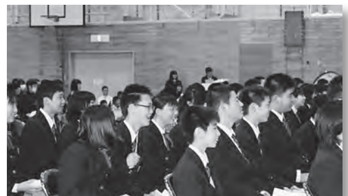
在校生の工夫を凝らした部活動紹介に 大興奮の1年生