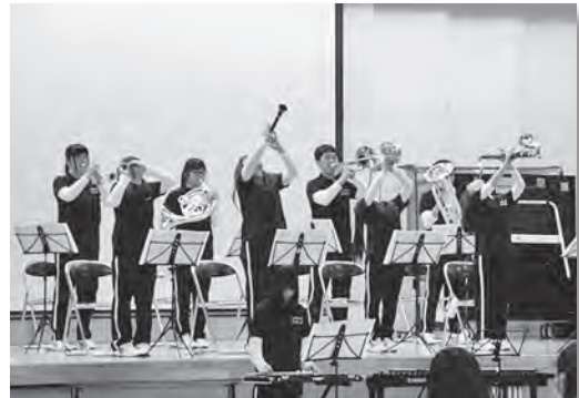
吹奏楽による軽快な演奏