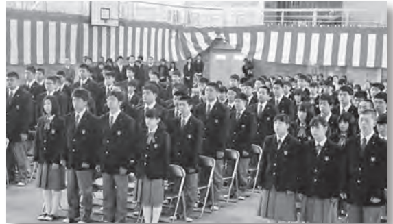
真新しい制服に身を包み緊張した表情の新入生