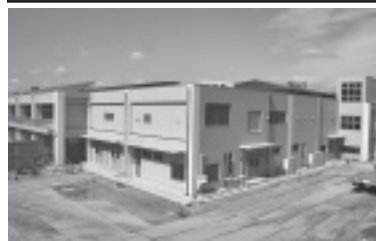
完成した給食センター