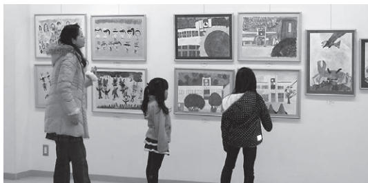
小学校・中学校美術展の様子

町内の小学生、中学生の作品の展示を昨年12月14日から12月26日まで行いました。会期中は家族連れが訪れ熱心に作品を鑑賞していました。