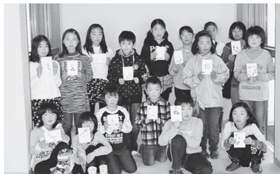
年賀状完成したよ！

出来上がった作品はどれも個性的で、子どもたちはうれしそうに自宅で持ち帰っていきました。