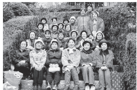
日赤奉仕団すみれ会の皆さん