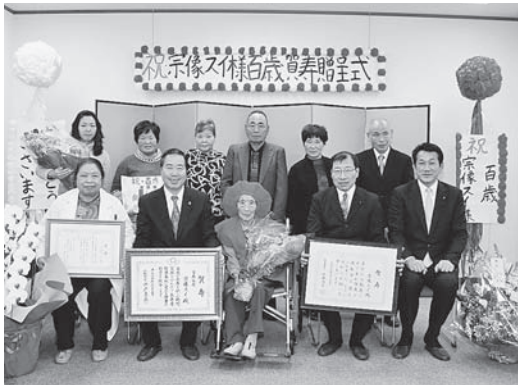
上) 賀寿を受け取るスイさん