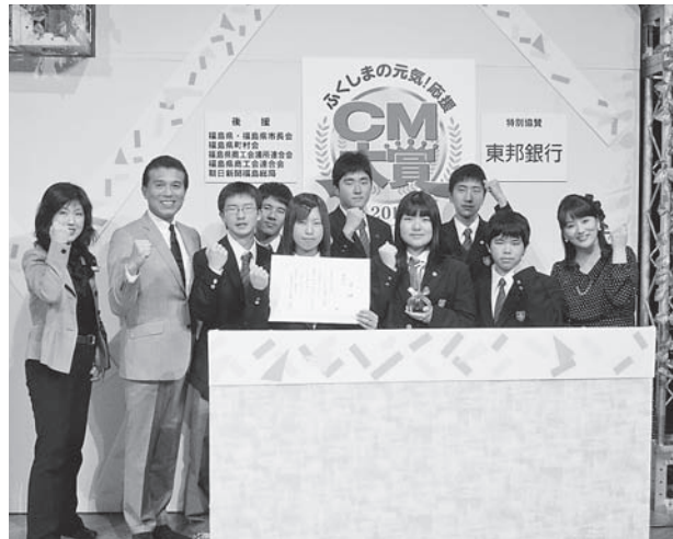
小野高校放送部の皆さん