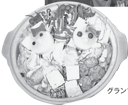
グランプリに輝いた 「猫豆乳鍋」

夏井第一小学校の子どもたちは、大根と人参でかわいらしい猫の顔をかたどり豆乳に浮かべた「猫豆乳鍋」を作り、見事グランプリに輝きました。子どもたちの挑戦した鍋料理は、具材やアイデアに驚かされる料理ばかりで、40人の小さな料理人と、地域の恵み・食材を育ててくれた生産者の方々への感謝の思いを感じる1日でした。