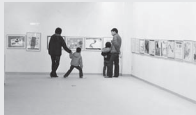
昨年の卒園児絵画展の様子

今年、町内の幼稚園・保育園・児童園を卒園する園児の絵画展です。作品の写真撮影もできますので、卒園記念にぜひご来館ください。