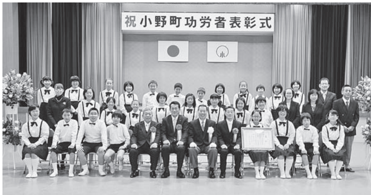
夏井第一小学校特設音楽部の皆さん

小野町功労者表彰式が11月23日勤労感謝の日に、多目的研修集会施設で行われました。 功労者表彰は、小野町表彰条例に基づき、小野町の政治、教育、文化などの振興に寄与された方々、または多くの人の模範と認められる行為があった方々に対して授与されるものです。今回表彰されたのは、特別功労6人、功労5人、善行3人4団体で、次の方々です。（敬称略）