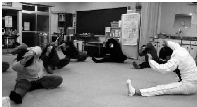
生活習慣病予防教室の様子

よっと検査値が高い、少しくらいは平気かな」が本当はとっても危険です。 健康福祉課では、生活習慣病予防のための健康・栄養相談会を実施しておりますのでお気軽にご相談ください。