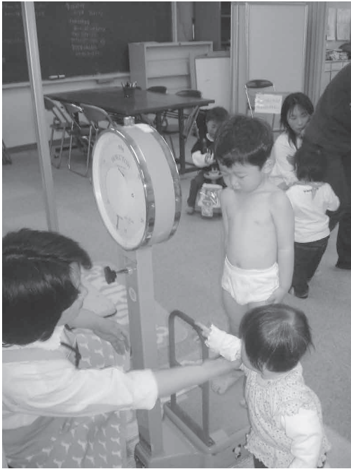
乳幼児健診の様子