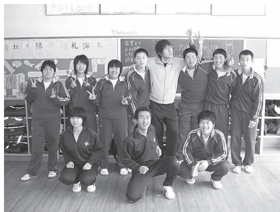
浮金中学校の卒業生と