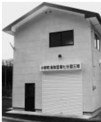
消防施設整備事業