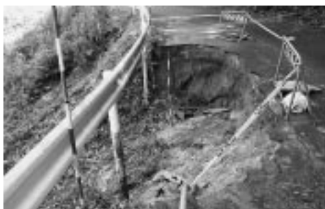
災害復旧事業(風越峠)