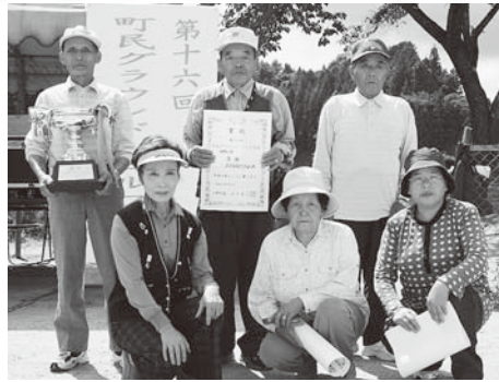
優勝 上羽出庭Aの皆さん