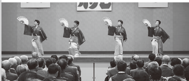
小野町連合婦人会の皆さん