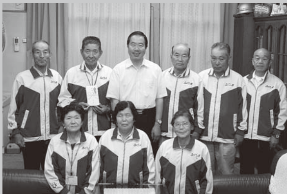
小野町チームの皆さん