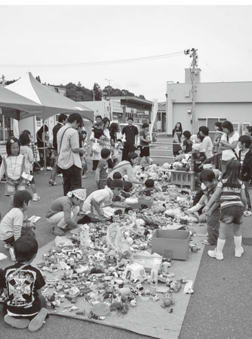
集めたポイントとおもちゃを交換します

第1回のおのまち「かえっこバザール」が9月19日、おのタウン・コムコムで開催されました。 主催は、キッズ・クラブ(子育て支援ボランティアサークル)で、当日は子どもから大人まで約250人が訪れ、とてもにぎわっていました。 「かえっこバザール」は自宅で遊ばなくなったおもちゃを持って行ったり、ゲームやお手伝いをしたりして「かえるポイント」をもらい、そのポイントと欲しいおもちゃを交換するシステムで、全国各地で行われています。