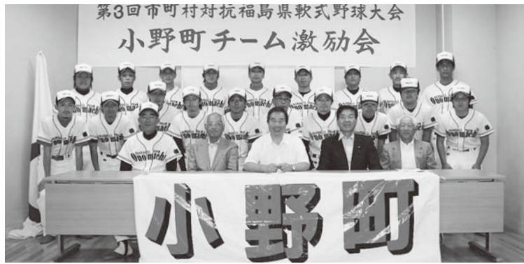
小野町チームの皆さん