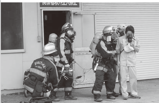
田村消防署救助隊による負傷者救出訓練