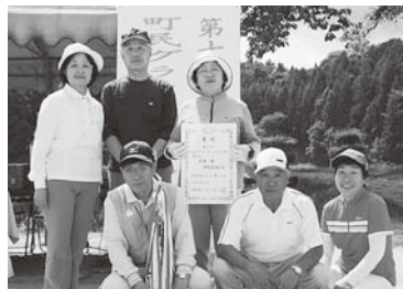
準優勝 仲町Aの皆さん