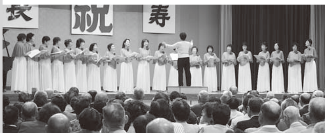
マドリガルコーラスの皆さん