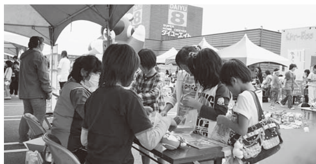
ゲームで遊んでもポイントがもらえます

第1回のおのまち「かえっこバザール」が9月19日、おのタウン・コムコムで開催されました。 主催は、キッズ・クラブ(子育て支援ボランティアサークル)で、当日は子どもから大人まで約250人が訪れ、とてもにぎわっていました。 「かえっこバザール」は自宅で遊ばなくなったおもちゃを持って行ったり、ゲームやお手伝いをしたりして「かえるポイント」をもらい、そのポイントと欲しいおもちゃを交換するシステムで、全国各地で行われています。