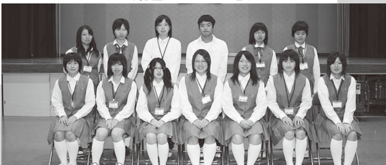
高校生ボランティアの皆さん