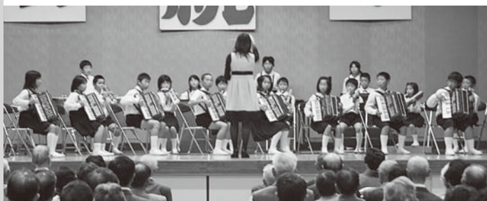
夏井第二小学校の皆さん