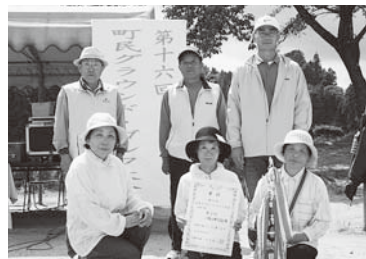
第3位 小野山神Aの皆さん

第16回町民グラウンドゴルフ大会を9月5日、運動公園多目的グラウンドと野球場で開催しました。大会には32チーム総勢約270名が参加し、グラウンドと野球場内に設けられた16ホールで熱戦を繰り広げました。