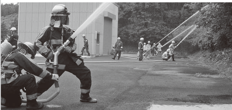
山林消火活動訓練

また、県警本部トライアルバイク隊による被害情報調査や消防団による遠距離中継送水訓練、防災ヘリコプターによる上空からの散水、関東エラストマー株式会社防災会による避難誘導および消火訓練など、関係機関と住民が一体となった訓練となり、参加者は本番さながらに真剣に取り組んでいました。