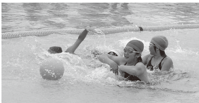
ボールに触らず運んでみよう