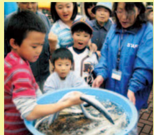
上: サンマつかみ大会 左: レトロカーショー