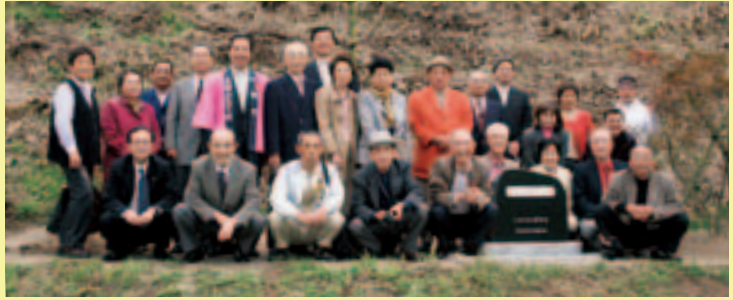
ふるさと小野町会創立10周年を記念し桜の木などを植樹