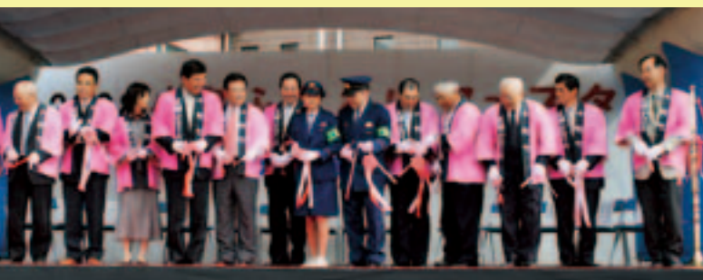
オープンセレモニー

10月25日・26日、小野運動公園において2008小町ふれあいフェスタを開催しました。町内外から約12,000人の方にご来場いただき、両日も大変賑わいました。フェスタでは、企業製品展、団体や個人の作品展、農作物品評会、商業びつくり市、栃木県日光市役所お囃子愛好会・日光和楽踊り隊の公演、県警音楽隊とカラーガード隊によるドリル演奏、小町夢太鼓、よさこい、太極拳、キャラクターションショー、レトロカーショーなどを行いました。 開催にあたり、ご協力いただいた皆さんに、紙上より厚くお礼申し上げます。