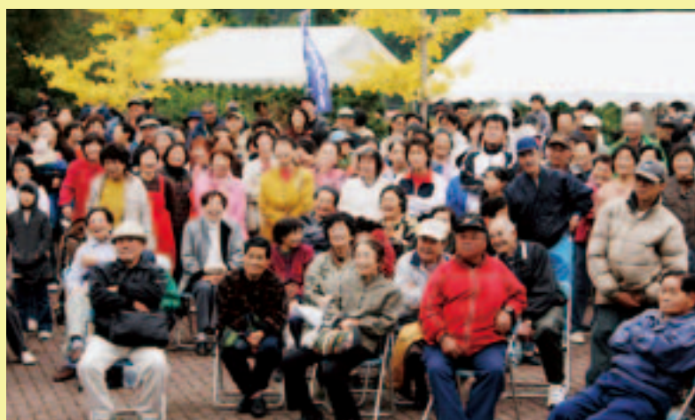
何が当たるかな～（お楽しみ抽選会）