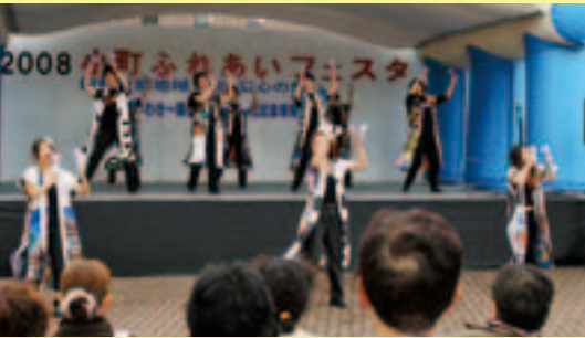
よさこい(小町よさこい隊)