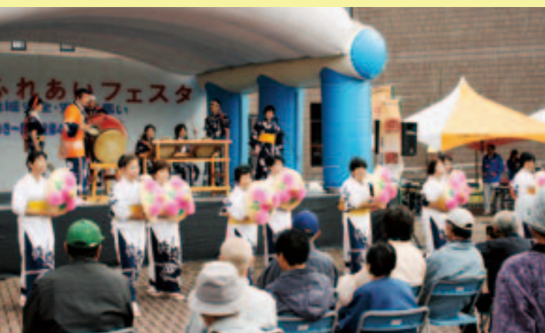
日光市役所お囃子愛好会と日光和楽踊り隊の皆さん