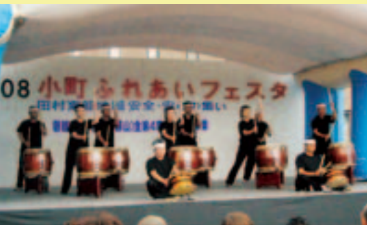
和太鼓の演奏(小町夢太鼓)