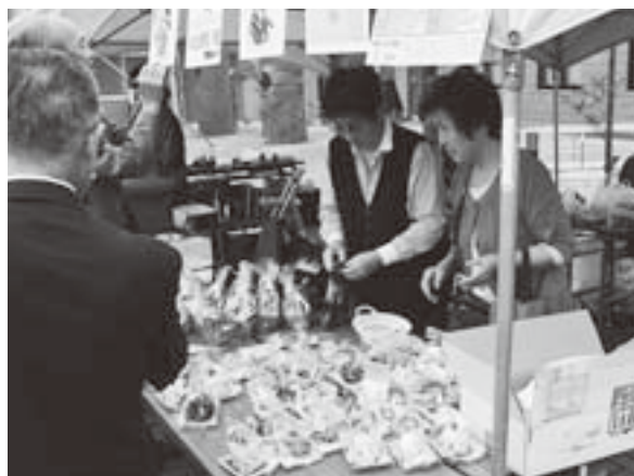
手芸品を販売している様子