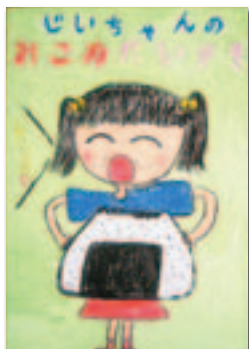
清野里那さんの作品