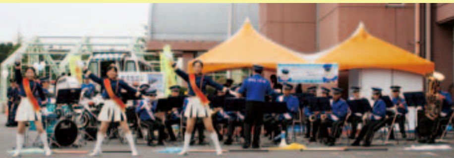
県警音楽隊とカラーガード隊のドリル演奏

10月25日・26日、小野運動公園において2008小町ふれあいフェスタを開催しました。町内外から約12,000人の方にご来場いただき、両日も大変賑わいました。フェスタでは、企業製品展、団体や個人の作品展、農作物品評会、商業びつくり市、栃木県日光市役所お囃子愛好会・日光和楽踊り隊の公演、県警音楽隊とカラーガード隊によるドリル演奏、小町夢太鼓、よさこい、太極拳、キャラクターションショー、レトロカーショーなどを行いました。 開催にあたり、ご協力いただいた皆さんに、紙上より厚くお礼申し上げます。