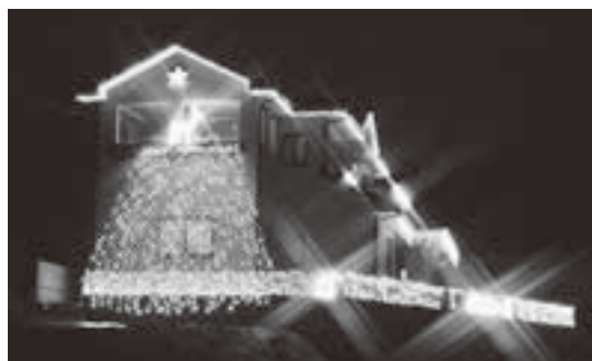
昨年ご応募いただいた一部

下記の応募票を切り取るかコピーをした用紙に、必要事項を記入し、イルミネーションを実施しているときの写真(L版～2L版)を添付し、事務局までお持ちください。