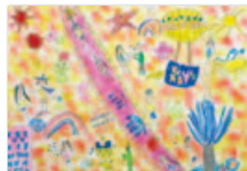
駒木根結衣さんの作品