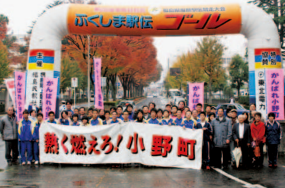
5時間59分18秒でゴール(福島県庁前で)

11月16日、第20回市町村対抗福島県縦断駅伝競走大会(ふくしま駅伝)が開催されました。51チームが参加し、白河総合運動公園陸上競技場から福島県庁までの16区間、96・2キロのコースで行われました。陸上競技場のスタンドや沿道には、のぼり旗や横断幕を掲げた応援団が大勢つめかけ、選手に大きな声援が送られました。応援していただいた皆さんに、紙上より厚くお礼申し上げます。また、監督・コーチをはじめ選手の皆さん、長期間にわたり本当にお疲れさまでした。今後も、ご活躍されることを期待しています。選手の皆さんの走行タイムは、次のとおりです。(敬称略)