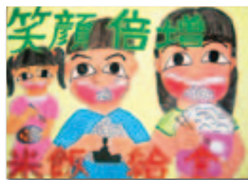
春山南苗さんの作品