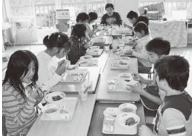
さんまの蒲焼き丼(浮金小学校)