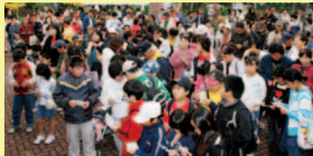
次は何番？（ビンゴ大会）