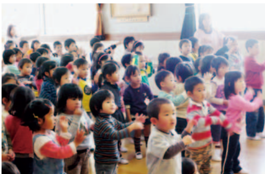
こう？ フラダンスって楽しいね！