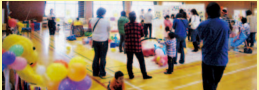
子育てフェスタの様子