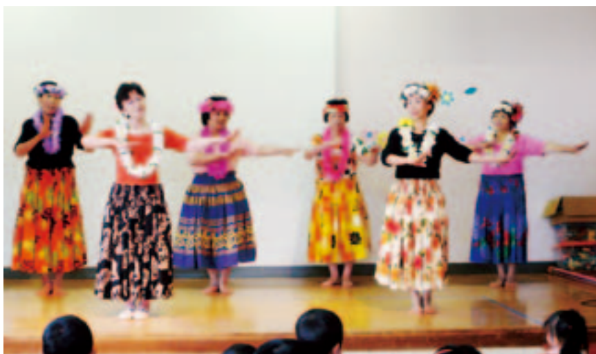
こんな風に踊ってね！

フラダンスの振り付けは手話になっていること、心を込めて踊ることなどを教えていただきながら、子ども達はハワイアンな雰囲気を楽しみました。