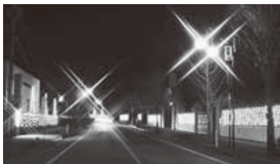
昨年のリカちゃん通りイルミネーションの様子