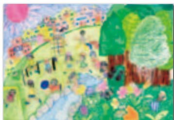
石井野絵さんの作品