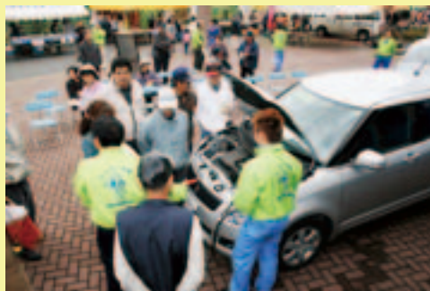
マイカー点検の実演