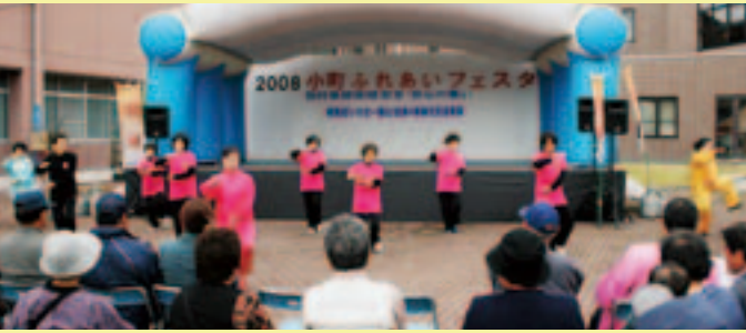
太極拳演舞(健寿会)