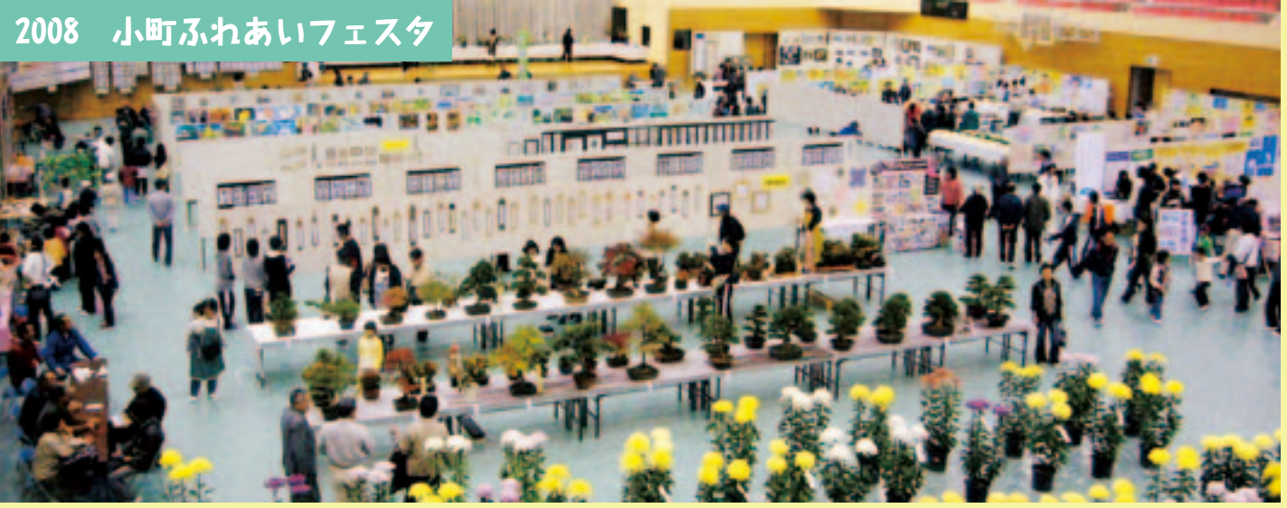
個人や団体のすばらしい作品の数々が展示されました