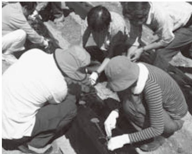
農作業体験の様子