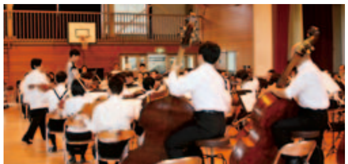
指揮者体験をしました