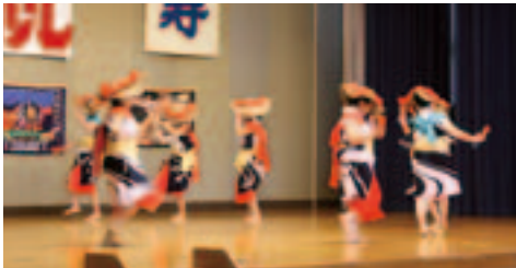
小野町連合婦人会の皆さん