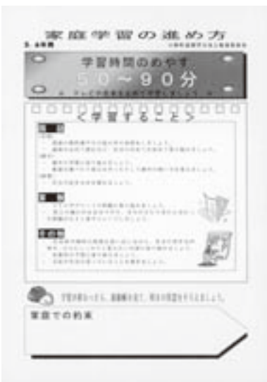
(上)小・中学生に配付した「家庭学習の手引き」