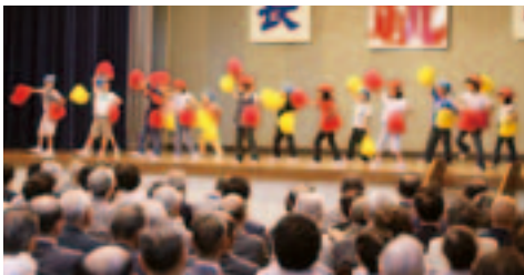
夏井第一小学校の皆さん(ダンス)

敬老会開催にあたり、行政区長、民生委員、高校生ボランティア、余興関係者など多くの皆さんのご協力をいただきましたことに対し、紙上より厚く御礼申し上げます。