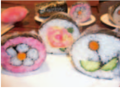
きれいなお花が完成!

おじいちゃん達もエプロン姿に照れつつ、酢飯と格闘。酢飯の中に花の形ができるので子どもたちも大喜び。苦手なインゲンやきゅうりを口にする子どももいました。 ご飯やおやつと一緒に作るなど、ちょっとした工夫が食への関心や食べる意欲につながります。おばあちゃん達には、これからもお孫さんとの手作りおやつなど食を通して子育てを応援していただけたらと思います。