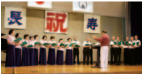
小町混声合唱団の皆さん