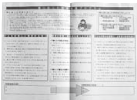
(右)教職員に配付した「個に応じた支援のあり方」