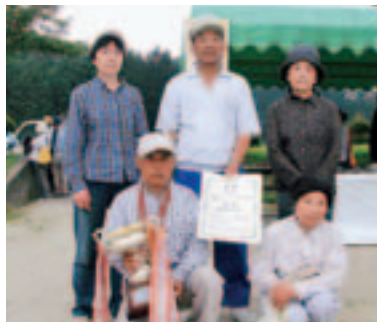
優勝 本町Bの皆さん

9月6日、小野運動公園多目的グラウンド、野球場において第15回町民グラウンド・ゴルフ大会を開催しました。 大会には32チーム総勢約270名が参加しグラウンド、野球場内に設けられた16ホールで熱戦が繰り広げられました。成績は表のとおりです。