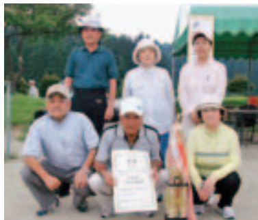
準優勝 仲町Aの皆さん

9月6日、小野運動公園多目的グラウンド、野球場において第15回町民グラウンド・ゴルフ大会を開催しました。 大会には32チーム総勢約270名が参加しグラウンド、野球場内に設けられた16ホールで熱戦が繰り広げられました。成績は表のとおりです。