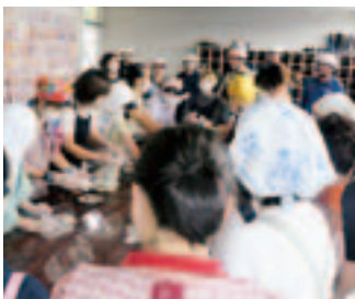
吹き出し訓練(自主防災会)