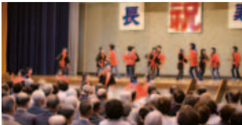
夏井第一小学校の皆さん(よさこい)