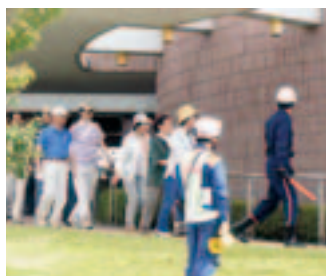
避難は慌てずゆっくり