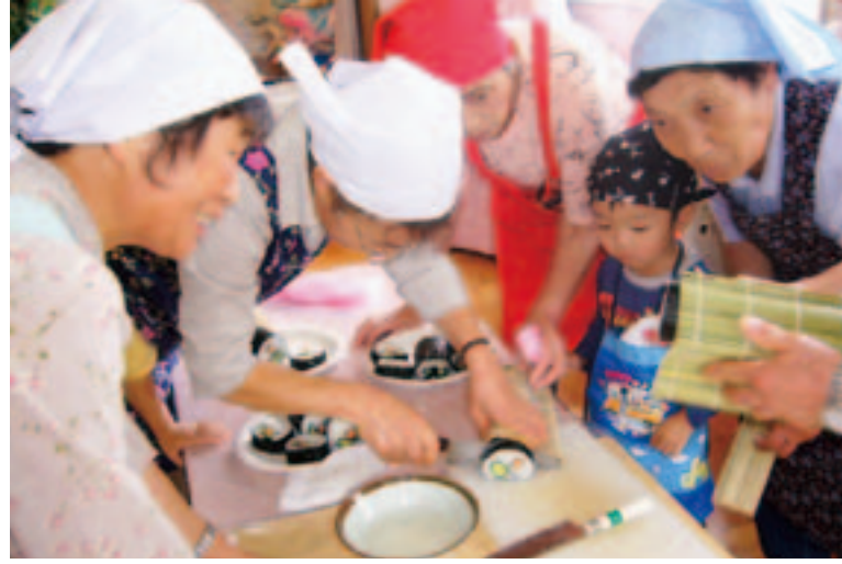
ちゃんと形になっているかな…ドキドキ!

おじいちゃん達もエプロン姿に照れつつ、酢飯と格闘。酢飯の中に花の形ができるので子どもたちも大喜び。苦手なインゲンやきゅうりを口にする子どももいました。 ご飯やおやつと一緒に作るなど、ちょっとした工夫が食への関心や食べる意欲につながります。おばあちゃん達には、これからもお孫さんとの手作りおやつなど食を通して子育てを応援していただけたらと思います。