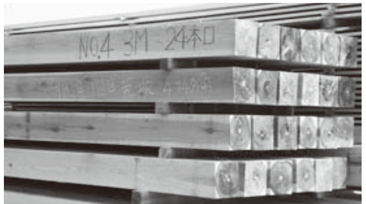
建築資材として町有林をプレゼントします！

町有林おすそわけ事業は、移住を希望される方の申請を受理した後、町有林の伐採と製材を行います。そのため、資材の提供までに時間がかかりますが、町有林の有効活用と町のPRのため趣旨をご理解いただき、積極的にご活用くださいますようお願いいたします。