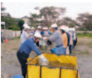
一つ一つ確実に(バケツリレー)