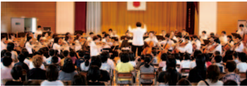
山形交響楽団によるオーケストラ演奏

また、「楽器のいろいろおぼえちゃおう」と題し、オーケストラで使われる一つ一つの楽器の説明を受け、代表児童が指揮者体験をしました。その他、山形交響楽団と全児童による「さんぽ」と「校歌」の合奏、合唱なども行われ、会場内が一体となり楽しいひと時を過ごしました。