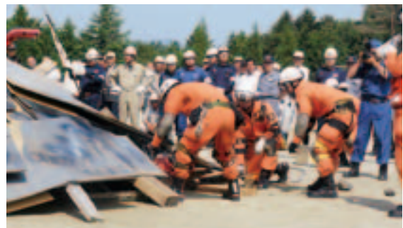
建物倒壊からの救助訓練(高度救助隊)

練、バケツリレーや消火器を使った初期消火、陸上自衛隊と自主防災会による吹き出し訓練などを行いました。 また、県警察本部トライアルバイク隊による被害情報調査や消防団による遠距離中継送水訓練、防災ヘリによる小野中学校屋上からの救助訓練、さらに本年7月8日に発隊した高度救助隊による建物倒壊からの救助訓練など、関係機関と住民が一体となった訓練となり、参加者は本番さながらに真剣に取り組んでいました。