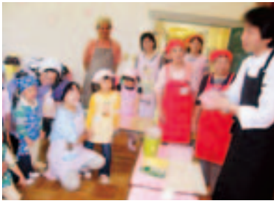
どんなお花になるのかなあ