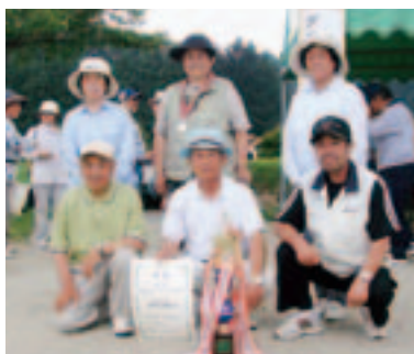
第3位 谷津作Dの皆さん