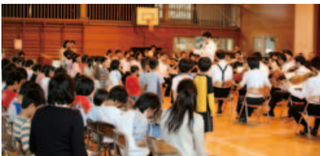
「さんぽ」「校歌」を全員で演奏