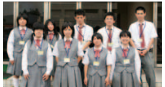
高校生ボランティアの皆さん