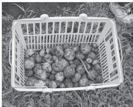
みんなで育てたじゃがいも