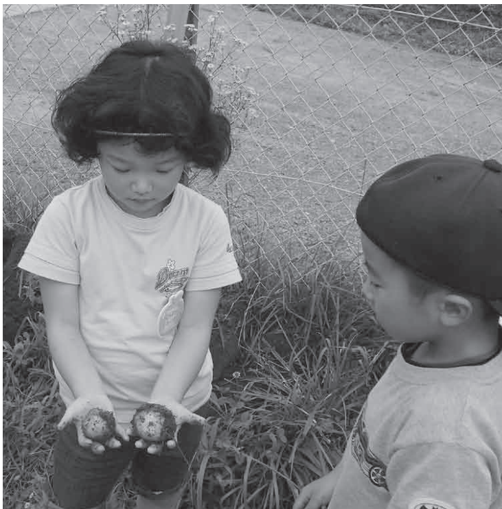
小さいけれど、じゃがいもです

心も体も元気でいられるよう、これからも子どもたちと一緒に「食」について考え、食べることに意欲のある子を育てていきたいと思えます。