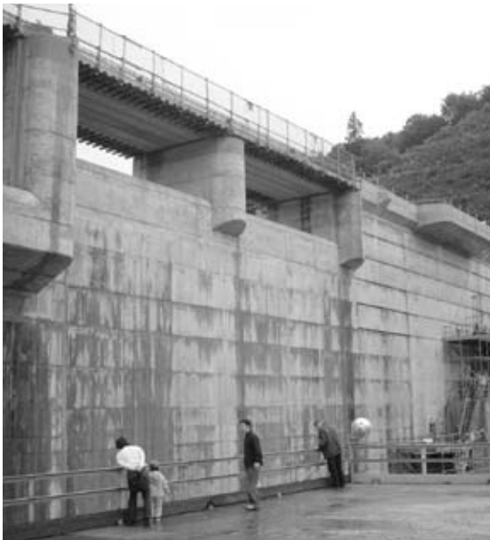
建設が進むこまちダム