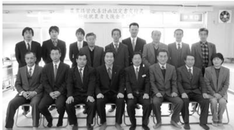
認定を受けたみなさん