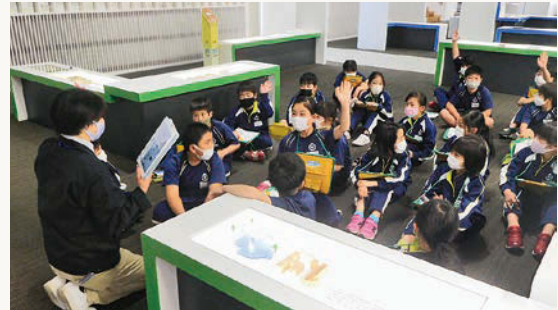
上/キックバイクに挑戦中の2年生 下/真剣に学ぶ4年生