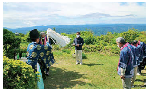
右／矢大臣山安全祈願祭