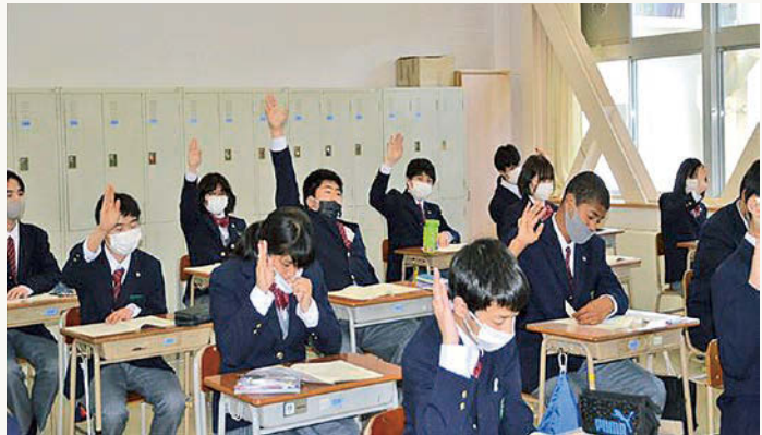
放送での生徒総会の様子