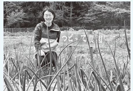
タマネギもすくすく成長中

小粒の種まきは…ああ、ツライ…。 細かな作業は苦手で「丁寧に丁寧に」と念仏のように唱えながら集中するのですが、種はあまりに小さくてつかめないうし、風が吹いたら舞ってしまうし、腰や肩は痛くなるし…苦行です。でも、苦行の後は喜びが！小さな芽がピョコッと出たらなんとかわいこと！うれしくてつい調子になり、また種をまいていたら…ずらずらと育苗トレーとポットが大行列となつてしまいました。まきすぎたか！?