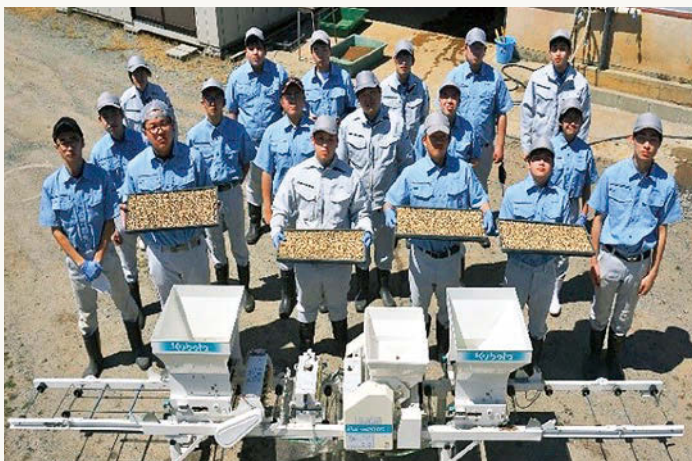
産業技術系列の3年生