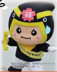
「なりすまし詐欺」被害防止マスコット カクコンジャー強くん