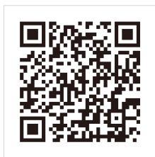
QRコードでLINEの友だちを追加

1から3までの住宅は、今後、人が住む可能性がありますが、4の「その他の住宅」は住む人を見つからないまま放置されてしまう可能性がります。 空き家そのものの存在が問題なのではなく、『放置されること』が問題なのです。 この空き家問題については、次の私の広報紙記事で引き続きお伝えしたいと思います。