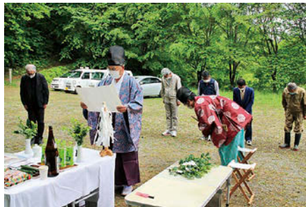
上／高柴山安全祈願祭

※例年開催している山開きは、新型コロナウイルス感染拡大防止のため、昨年度に引き続き中止となりました。