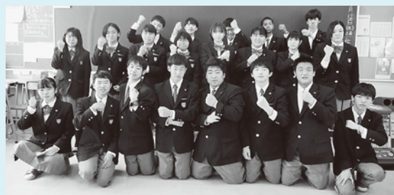
1年2組、3年福祉教養系列の皆さん