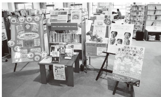
認知症図書コーナーの様子

今後これらの認知症関連書籍は、小野町地域包括支援センターでも貸し出しを行っていますので、ぜひご利用ください。