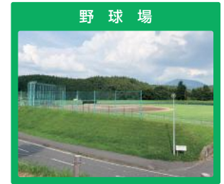
野 球 場