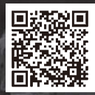
小野町防災 ガイドブック QR