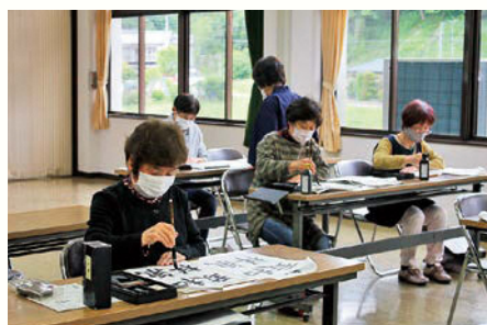
書道クラブの様子