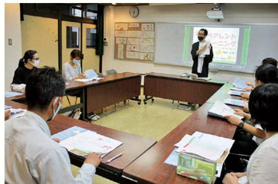
ペアレントトレーニング講座の様子