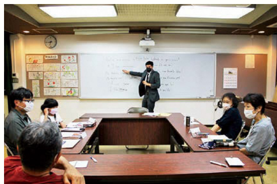
イブニングクラスのクリスチャン先生