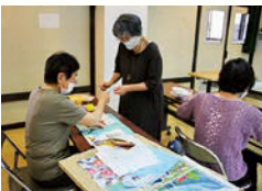
ちぎり絵クラブの様子