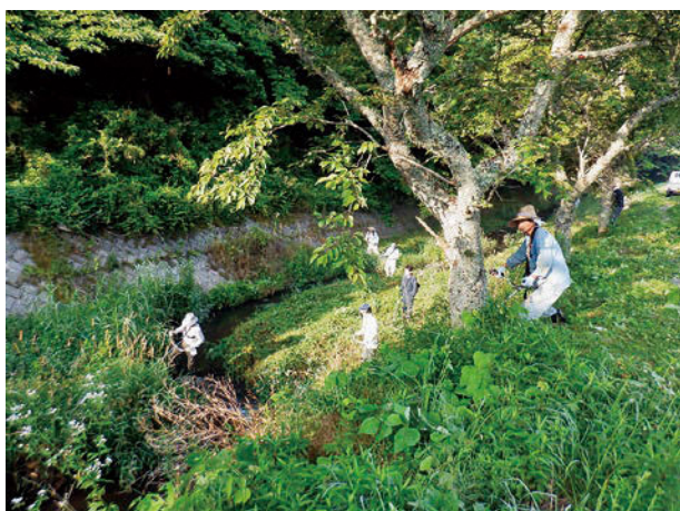
クリーンアップ作戦の様子