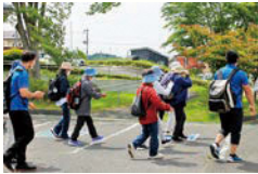
健康ウォーキングクラブの様子