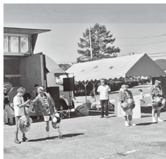
「小野町楽しい場所創造事業」