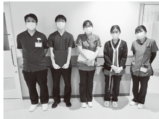
摂食・嚥下サポートチーム