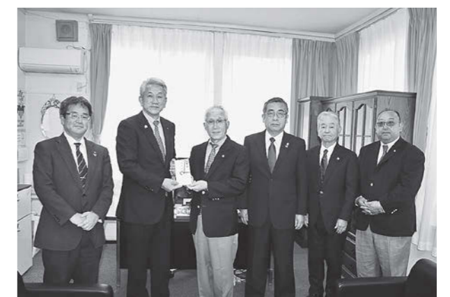
太田会長(左から3番目)とライオンズクラブの皆さん