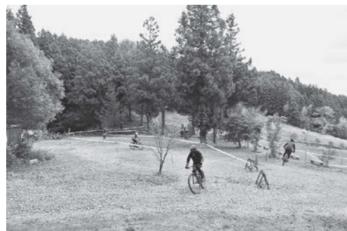
「小野ふれあいオフロードパークの活用集客事業」