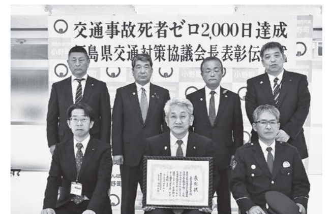
表彰伝達式の様子

これからも交通事故死亡者ゼロの継続を目指し、子どもや高齢者を思いやる運転に努め、交通ルールを守りましょう。