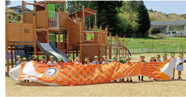
手作りのかぶとを被り大きなこいのぼりと一緒に写るおのまち認定こども園の園児たち。 こいのぼりの様に大きく元気に育ってほしいです。