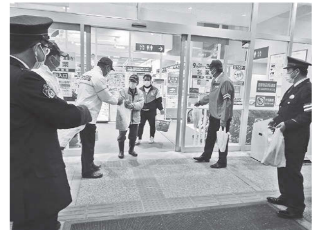
街頭啓発活動の様子

ドライバーの皆さん、子どもを交通事故から守るため、正しい交通ルールで思いやりのある運転に努めましょう。