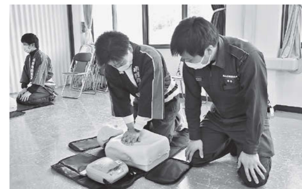
新入団員の普通救命講習の様子