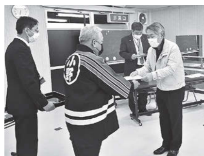
委嘱状交付式の様子