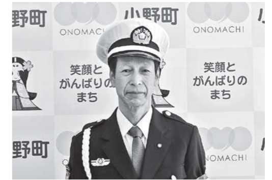
先崎交通安全教育専門員

車の往來の激しい交通危険箇所、交通事故防止のため街頭に立ち、地域住民を交通事故から守るために活動していただきます。