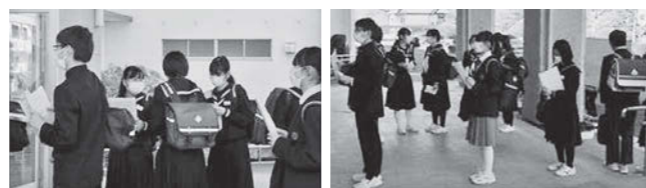
合格通知の受け取りに並ぶ生徒

合格者の皆さん、おめでとうございます。これから小野高校で「夢をカタチに」する第一歩を踏み出しましょう。