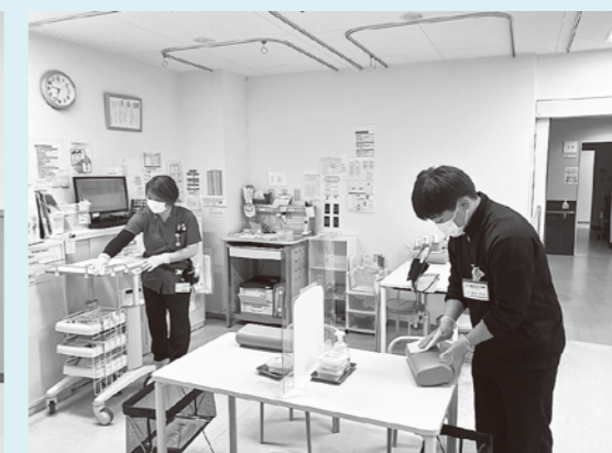
高校生サマーショートボランティアの様子