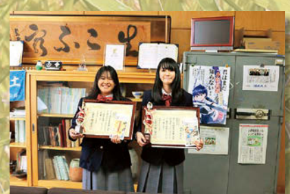
高校生の部入賞者