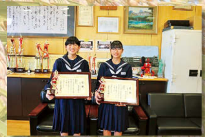
中学生の部入賞者