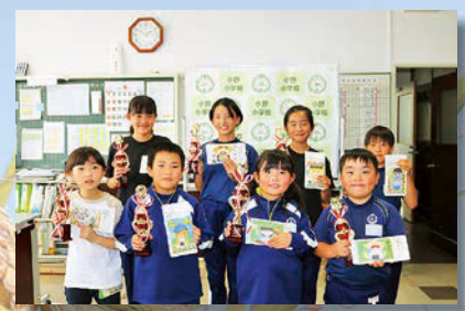
小学生の部入賞者