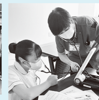
高校生一日看護体験の様子