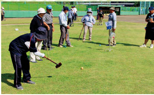
グラウンド・ゴルフ大会の様子