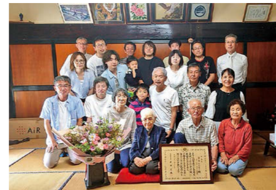
宗方さん(中央)とご家族の皆さん