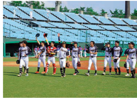
第17回市町村対抗福島県軟式野球大会でベスト8進出を果たした小野町チーム。熱戦を繰り上げてくれた選手の皆さんお疲れさまでした！ 関連記事：6ページ