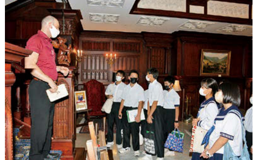
マナーハウスを見学しました

始めに模擬的な入国審査とマナーハウス(英国建築施設)の見学に臨みました。「名前は?」「どこから来たの?」などの質問を英語で受け、英語漬けの研修が始まることを実感しました。マナーハウス見学では、本格的な英国建築の施設を目の当たりにして、生徒たちは興味津々でした。