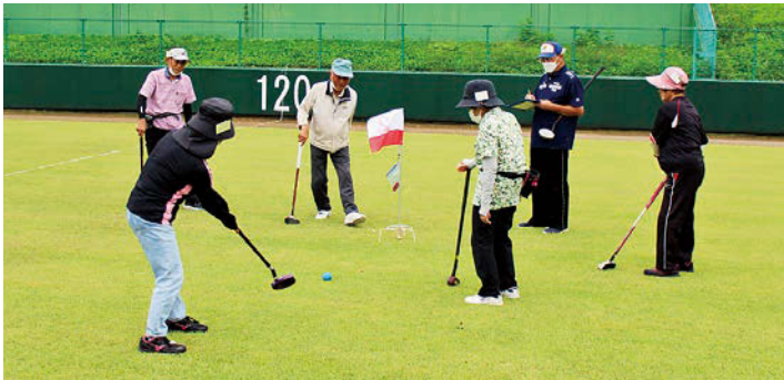
グラウンド・ゴルフ大会の様子