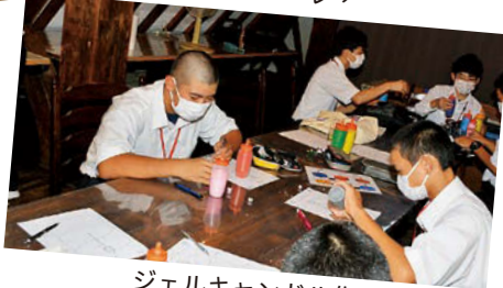
ジェルキャンドル作り