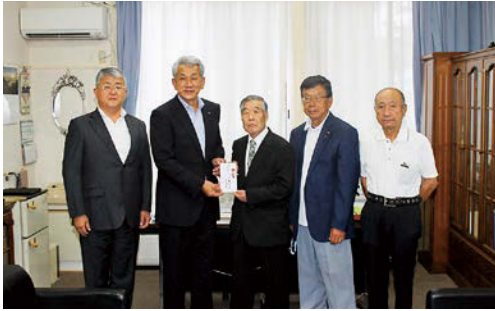
左から教育長、町長、吉成会長、西牧副会長、大竹副会長

小野町自衛隊家族会様から、文化・体育振興基金にご寄付をいただきました。紙上より厚くお礼申し上げます。 この基金は、小・中・高校生の全国大会出場時の激励金や表彰、スポーツ少年団などへの補助や活動費など、有効に活用させていただきます。