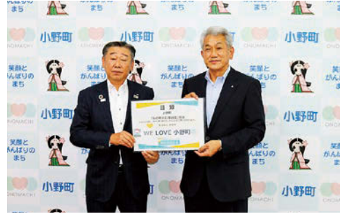
白岩所長(左)と町長(右)

明治安田生命保険相互会社様から、町に対しご寄付をいただきました。紙上より厚くお礼申し上げます。 同社は昨年八月に健康増進に関する包括連携協定を結び、町の健康づくりの取り組みに協力いただいています。