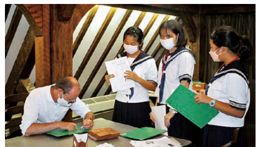
サインをいただきました

この研修をきっかけに、英語の学習にさらに力をいれていただき、世界に羽ばたける人材に育ってほしいと思います。