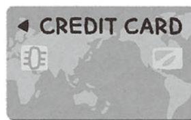
クレジットカード