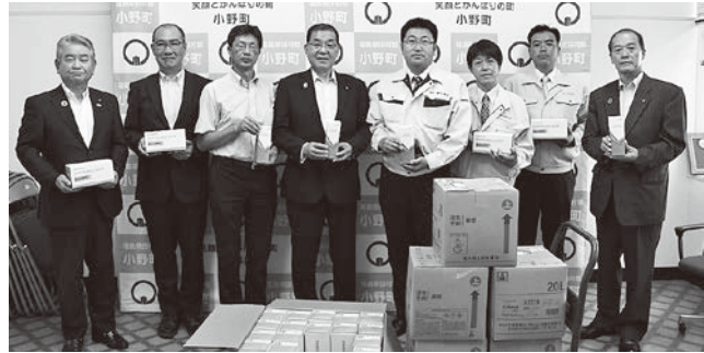
吉間田滝根線安全協議会の皆さん