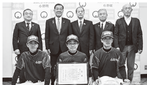
小野町チームの皆さん