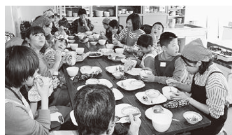
おいしくいただきました！