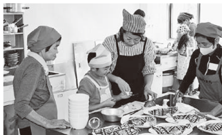
うまくむけるかな？

参加者からは「子どもと一緒に作って楽しかった」「マヨネーズの油の量の多さに驚いた」などたくさん感想が寄せられました。