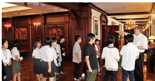
マナーハウス内を見学