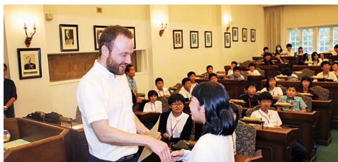
修了証をいただきました

小学生の英語力向上と各小学校の児童の交流を図るため、天栄村のブリティッシュ・ヒルズで国際交流体験事業が行われました。 入国審査模擬体験や英国文化を学ぶマナーハウスツアーに始まり、英会話レッスンでは、世界の国々の国旗やお祭りについて学んだりパズルやゲームをしながらリスニング力アップを図りました。 児童の皆さんは楽しみながら本場の英語に触れ、英国文化への理解を深めました。