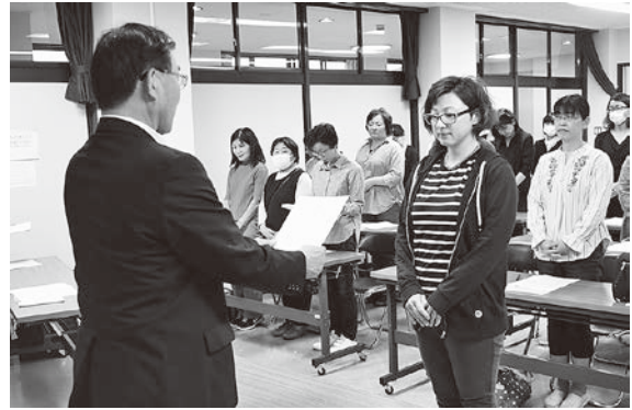
委嘱状交付の様子