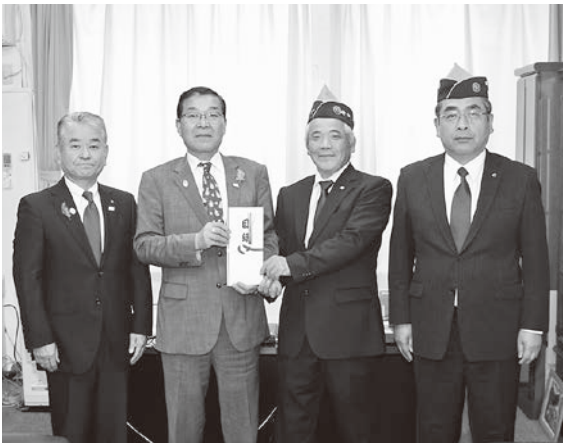
(左から) 教育長・町長・郡司小野町ライオンズクラブ会長・ 吉田小野町ライオンズクラブ実行委員長

小野町文化・体育振興基金は、町の文化と体育の振興・充実をはかるために個人や団体からの寄付により積み立てている基金です。