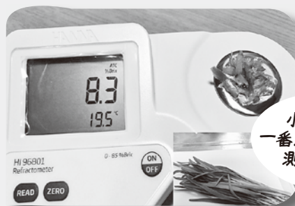
小野町産の 一番ニラの糖度を 測りました

本人も、元気な赤ちゃんを産んで、再び協力隊として、皆さんにお会いする日を楽しみにしています。