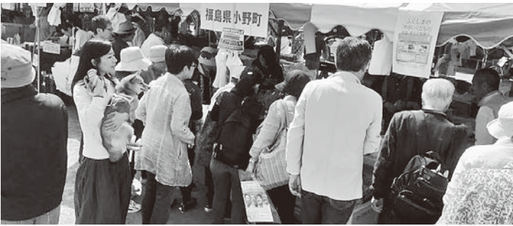
多くのお客さんでにぎわった小野町ブース

野町産の野菜や加工品などを展示販売しました。ふるさと小野町会の方にご協力いただき、多くの来場者に小野町の特産品をPRすることができました。