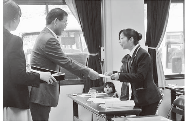
委嘱状交付の様子