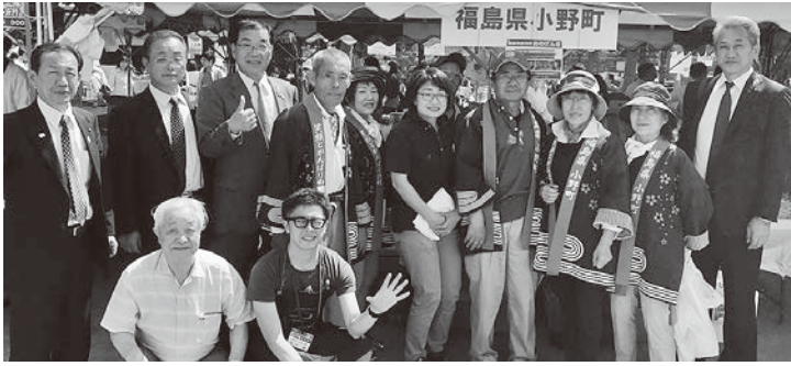
特産品PRにご協力いただいたふるさと小野町会の皆さん