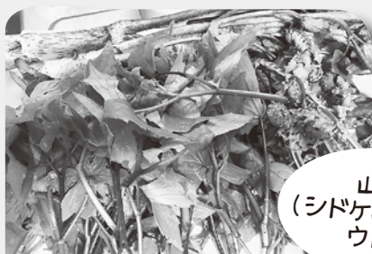
山菜 (シドケ、コゴミ、ウド)