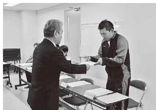
委嘱状交付の様子