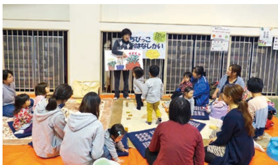
ちびっこおはなし会の様子

乳幼児と保護者の方を対象にした「ちびっこおはなし会」が始まりました。5月は子育て支援課の「幼児のわくわくタイム」とのコラボレーション企画として行い、絵本の読み聞かせや手遊びをしてすごしました。今後も「わくわくタイム」内やこどもの笑顔ひろばで行います。ぜひご参加ください。