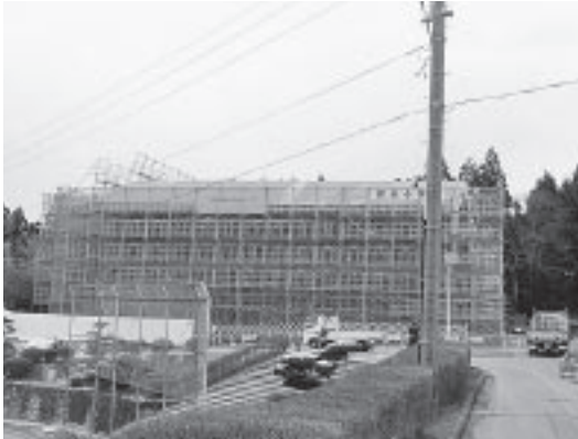
小野中学校改築整備事業