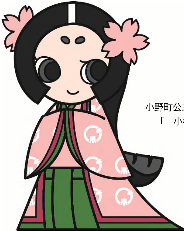
小野町公式イメージキャラクター 「 小桜ちゃん 」