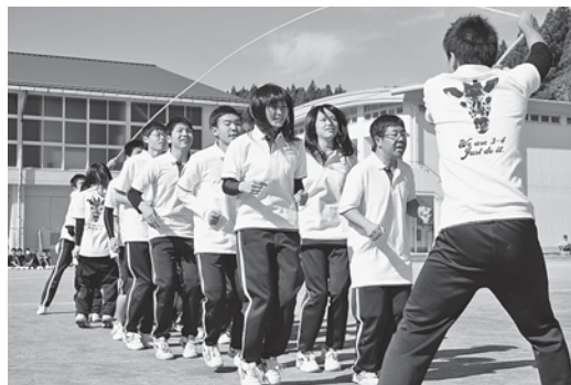
クラス一丸となって競技に取り組む生徒