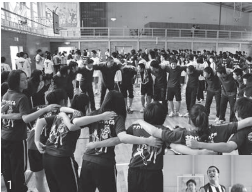
1_勝利を目指しクラス一丸となる生徒たち/2_バスケットボールでは熱い戦いが展開