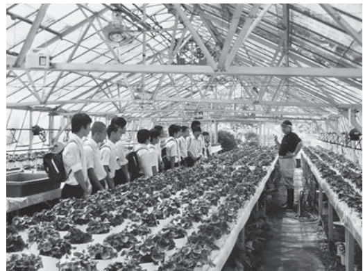
産業系列での授業を体験する中学生