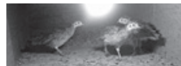
とても成長の早いヒナたち