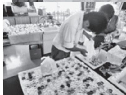
上/エコキャップ運動のPR 下/回収したキャップを洗浄中