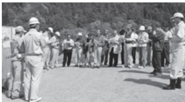
川俣町職員から説明を受ける参加者

視察会では、川俣町の担当者や自治会副会長から仮置き場の構造や設置に至る経過などの説明を受け、保管容器の内容物や重量など疑問に思っていることなどについて質問を行いました。その後、サーベイメータを使用して保管されている土壌など周辺の山林とを比較して仮置き場の放射線量が低いことを参加者