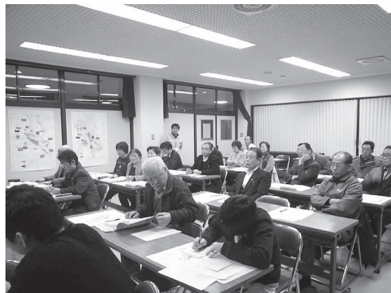
ワークショップのようす