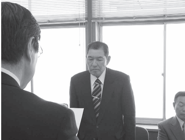
長久保喜伸湯沢行政区長