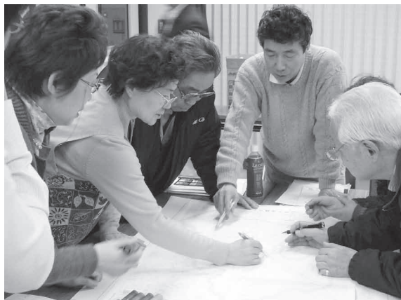
熱心に取り組む参加者のみなさん