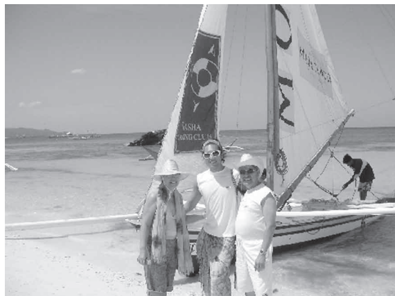
ボラカイビーチで両親と

私は、今度のゴールデンウィークにおいて、みなさんの旅行が、事故が無く、とても有意義なものとなるように祈っております！