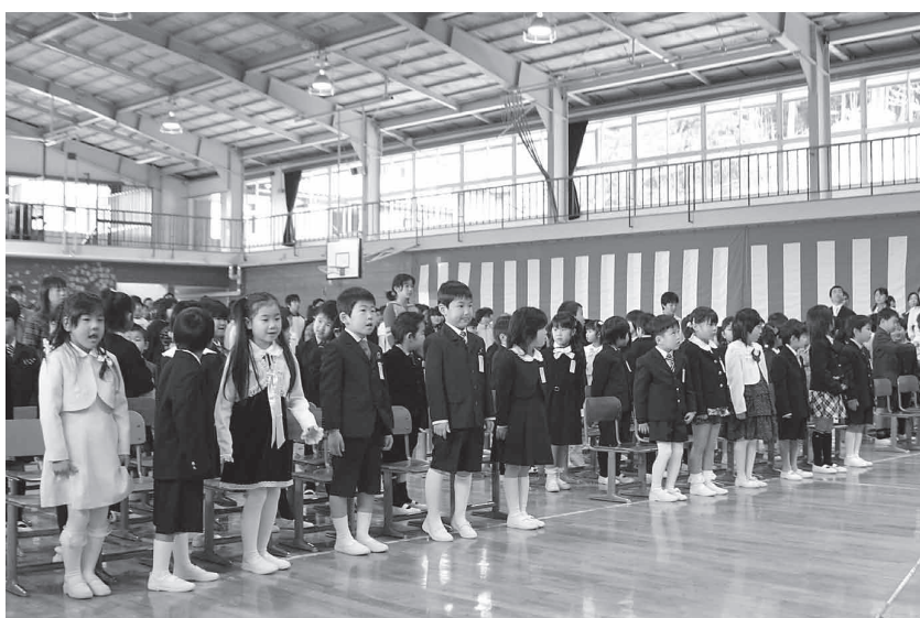
小野新町小学校の入学式の様子

地方自治法第243条の3並びに小野町財政状況の作成及び公表に関する条例の規定に基づき、平成18年度下半期の財政状況についてお知らせします。