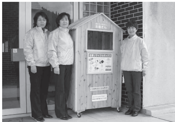
保健福祉センター前の古着回収ボックスと商工会女性部の役員のみなさん

※リサイクルボックスで回収しないもの 布団・枕、ぬいぐるみ、ナイロンビニール素材のもの、汚れのひどい毛布・シーツ・中綿の入ったキルティング素材のもの、汚れのある化繊のジャンパー・コート・ジャケットなど、パンツ類、おもちゃ・ハンガーなど。