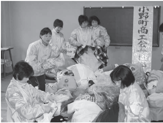
熱心に作業する女性部員のみなさん

リサイクルボックスは商工会玄関に設置されていますが、このほど保健福祉センター（小野警察署となり）玄関前にも増設されました。女性部のみなさんは、「リサイクルの輪を町中に広めていきたい。」と熱心に活動に取り組んでいます。町民のみなさんのご協力をお願いします。