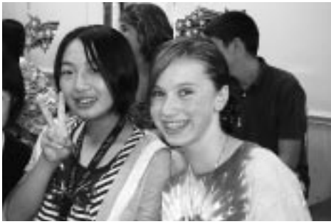
ホストファミリーと

今回、私たちが10日間で学んだ貴重な経験を、日ごろの生活や学習に生かしていきたいです。