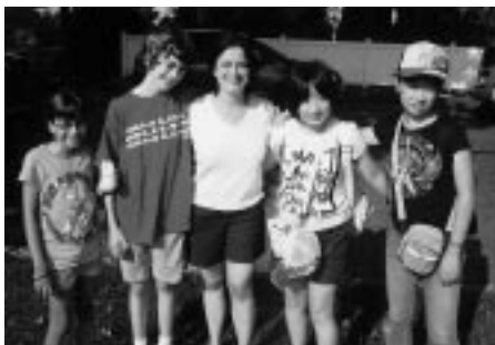
ホストファミリーと(右)

今回、アメリカで過ごした10日間は、私にとってとても貴重な経験になりました。グレンロック町の町長さんをはじめの方やホストファミリーが温かく歓迎してくれたので、安心して研修することができました。とても感謝しています。印象に残ったのは、国連本部や自由の女神を見学したことです。見るもの聞くものすべてが初めてで、とても勉強になりました。そしてアメリカでの食事はどれもボリュームがあり、驚きました。