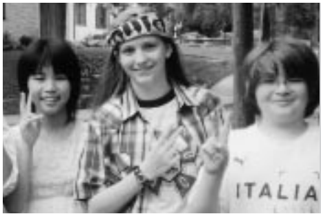
ホストファミリーと