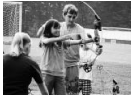
キャンプ場でアーチェリー体験

私はサマーキャンプ中学生の翼でアメリカに行くことになり、うれしさや楽しみな気持ちの反面、不安でいっぱいでした。不安だったのは、英語ではっきり気持ちを伝えられるか、食事はしっかりとれるかなどです。でも、ホストファミリーと初めて会ったとき、とても安心して話しました。みんな明るく、たくさん話し掛けてくれてすぐに仲良くなりました。またグレンロックはとてもきれいな町で、楽しい日々が送れました。